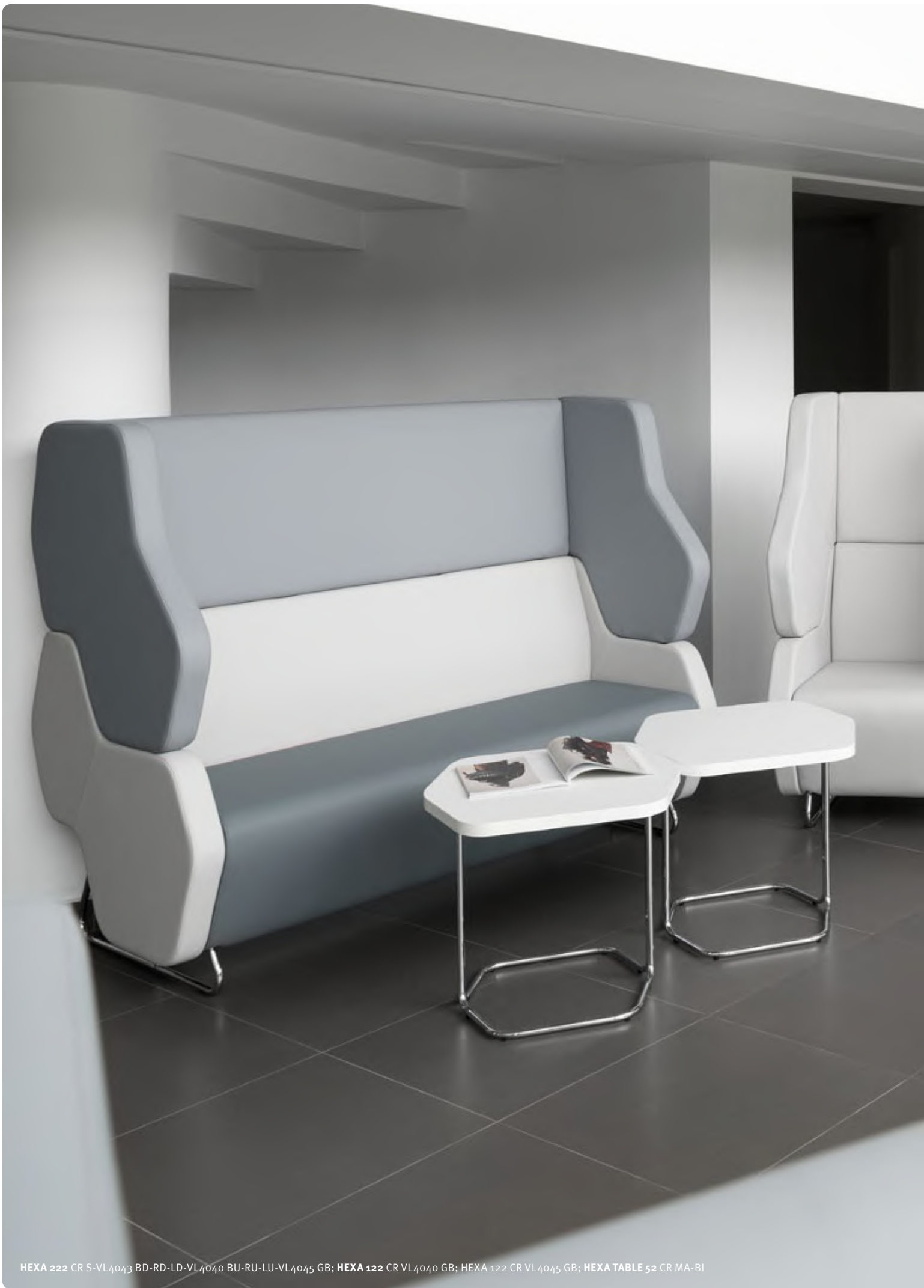
HEXA 222 CR S-VL4043 BD-RD-LD-VL4040 BU-RU-LU-VL4045 GB; HEXA 122 CR VL4040 GB; HEXA 122 CR VL4045 GB; HEXA TABLE 52 CR MA-BI