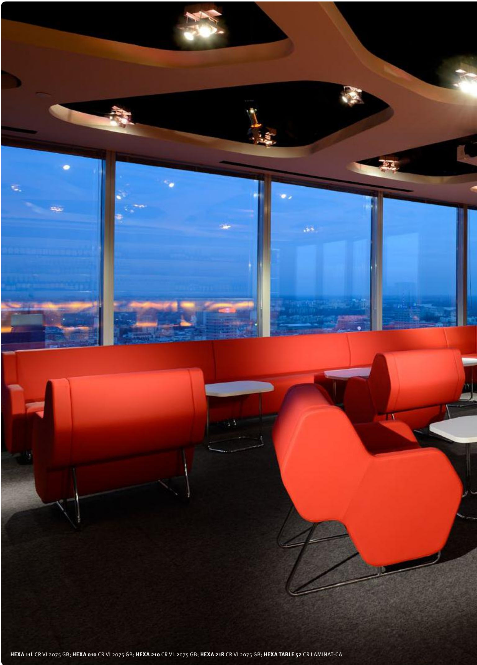
HEXA 11L CR VL2075 GB; HEXA 010 CR VL2075 GB; HEXA 210 CR VL 2075 GB; HEXA 21R CR VL2075 GB; HEXA TABLE 52 CR LAMINAT-CA