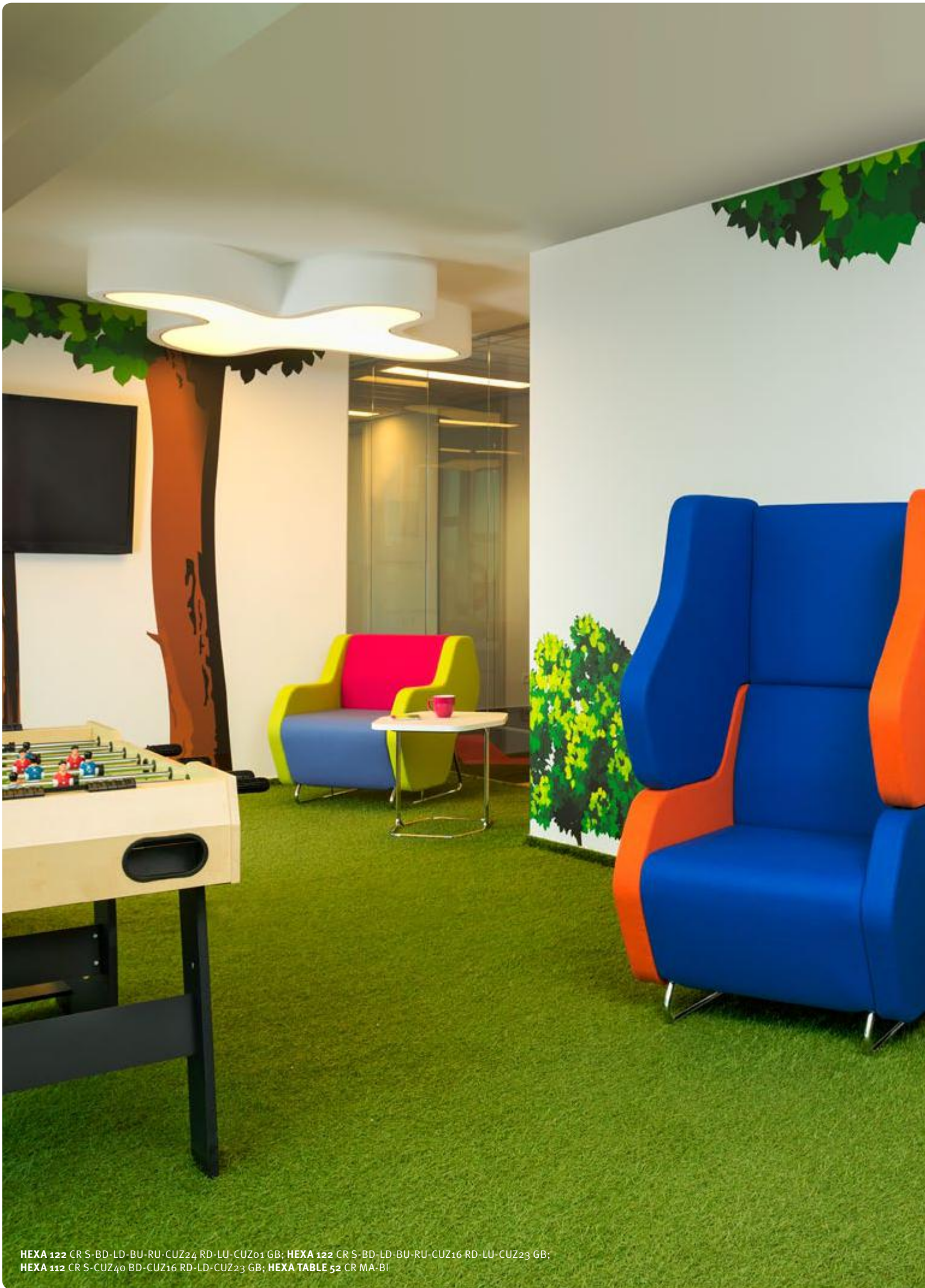
HEXA 122 CR S-BD-LD-BU-RU-CUZ24 RD-LU-CUZ01 GB; HEXA 122 CR S-BD-LD-BU-RU-CUZ16 RD-LU-CUZ23 GB; HEXA 112 CR S-CUZ40 BD-CUZ16 RD-LD-CUZ23 GB; HEXA TABLE 52 CR MA-BI